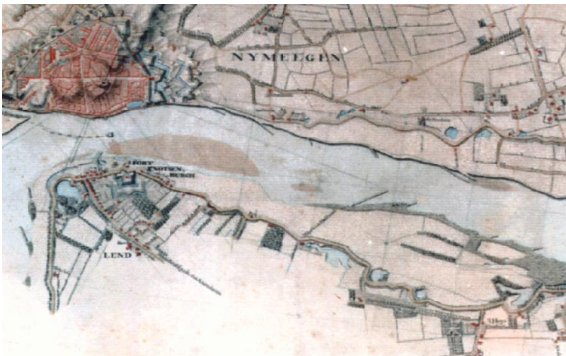
Kaart De Man 1800

Ons hout is gedateerd op 155 +/- 30 BP dwz 1950 – 155 is ongeveer 1795.