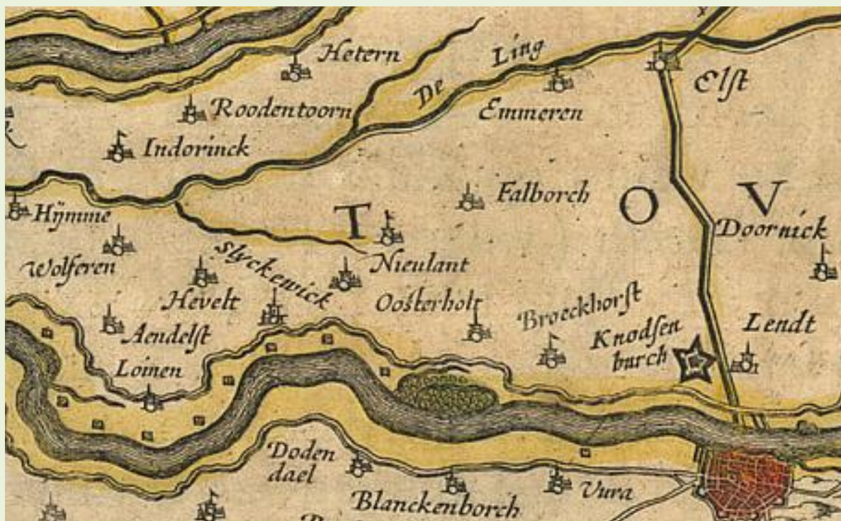
Afbeelding uit Tractus Rheni et mosa... 1645.

Tractus Rheni et Mosæ totus[que] Vahalis à Rhenoberca Gorcomium usque cum terris adjacentibus. Wereldatlas van Willem Blaeu, Atlas Novus samengesteld door zijn zoon Joan Blaeu.