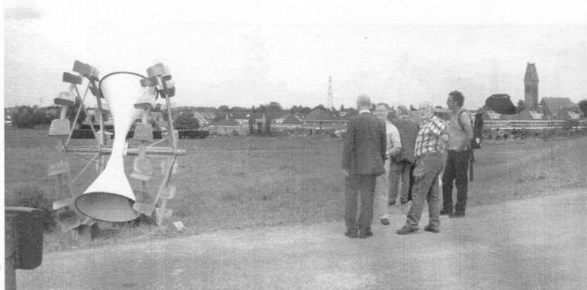
Juni 2009. Bezichtiging van het kunstwerk op 26 juni j.l. door de dijkgraaf van het Waterschap Rivierenland, de kunstenaar, leden van de kunstcommissie gemeente Overbetuwe en leden van de historische kring Oosterhout/Slijk-Ewijk e.o.

Iedereen is natuurlijk vrij om de eigen fantasie er op los te laten, zoals de kunstenaar zei, maar een kunstwerk krijgt altijd meerwaarde als je het achterliggende verhaal kent.