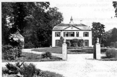
Huis Loenen rond 1960.

Op woensdag 28 oktober komt bouwhistoricus Willem Ormel uit Oosterbeek in het dorps huis van Slijk-Ewijk vertellen over zijn onderzoek in Loenen. Zie ook verderop in dit blad.