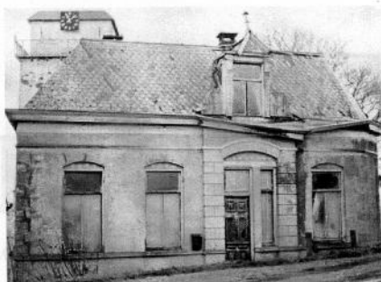
De rentmeesterswoning kort voor de afbraak in 1976. Op de achtergrond de kerk van Slijk-Ewijk.

In een volgende uitgave kunnen we u hier vast meer over vertellen.