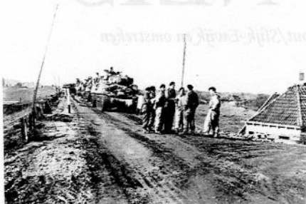
Britse tanks op de Waaldijk in Oosterhout bij de afweg van de Dorpsstraat. Gezien richting Slijk-Ewijk. Foto ongedateerd.

In september 1944 werd onze omgeving na hevige gevechten bevrijd van de Duitse bezetting, waarmee in Oosterhout en Slijk-Ewijk de Tweede Wereldoorlog beëindigde. Deze maand is dat dus 65 jaar geleden. In deze uitgave van Oud Neis vindt u dan ook een aantal bijdragen met de Tweede Wereldoorlog als onderwerp.